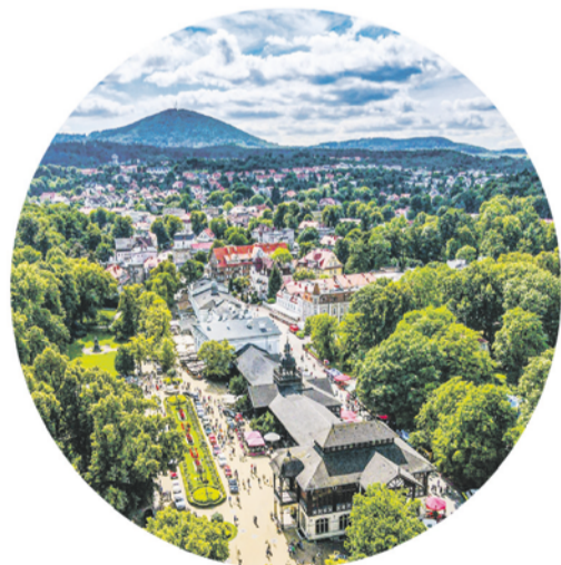
Wymiana pieców program „Kawka”

Cały wywiad na stronach: www.30minut.pl www.naszemisto.walbrzych.pl