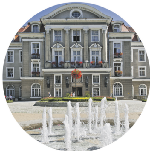
Czujnik poziomu zanieczyszczeń umiejscowiony w Domu Zdrojowym