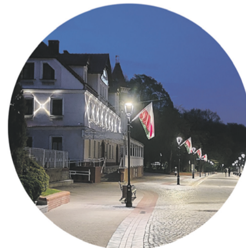
Wymiana oświetlenia zainstalowano 800 lamp LED